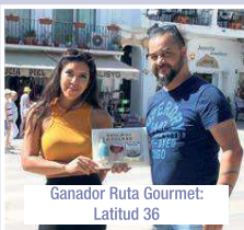
Ganador Ruta Gourmet: Latitud 36

tando por que Mijas diversifique sus esfuerzos para atraer a turistas de todo el mundo con la presencia del municipio en ferias de turismo, como la de París en la que estará presente próximamente. El primer edil matizó que esto es fundamental para diversificar el trabajo con los turoperadores. En este sentido, recordó que "Mijas ha sido uno de los municipios menos afectados de la provincia por la quiebra de Thomas Cook, que ha dejado a cerca de 600.000 turistas en destinos de todo el mundo".